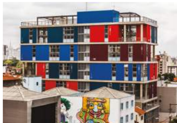
BOX 298 / ANDRADE MORETTIN

IDEA!ZARVOS É MAIS QUE UM JEITO DE MORAR. É UMA FORMA DE VIVER. CADA PRÉDIO É UM PROJETO AUTORAL, ASSINADO POR ARQUITETOS RENOMADOS QUE PARTICIPAM DESDE A SUA CONCEPÇÃO. O RESULTADO É UM PRÉDIO QUE SURPREENDE O MORADOR POR TER A SUA CARA, O BAIRRO POR SER INTEGRADO A TUDO AO SEU REDOR E O INVESTIDOR POR TER UMA VALORIZAÇÃO MAIOR. É ESSE O NOSSO JEITO DE FAZER UMA SÃO PAULO CADA VEZ MELHOR.