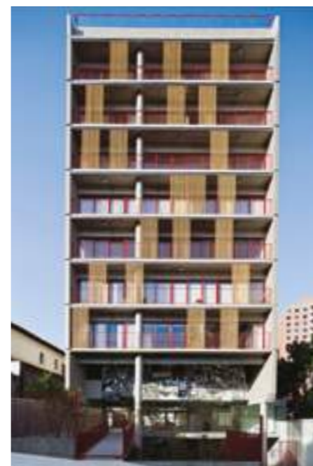
SIMPATIA 236 / GRUPO SP