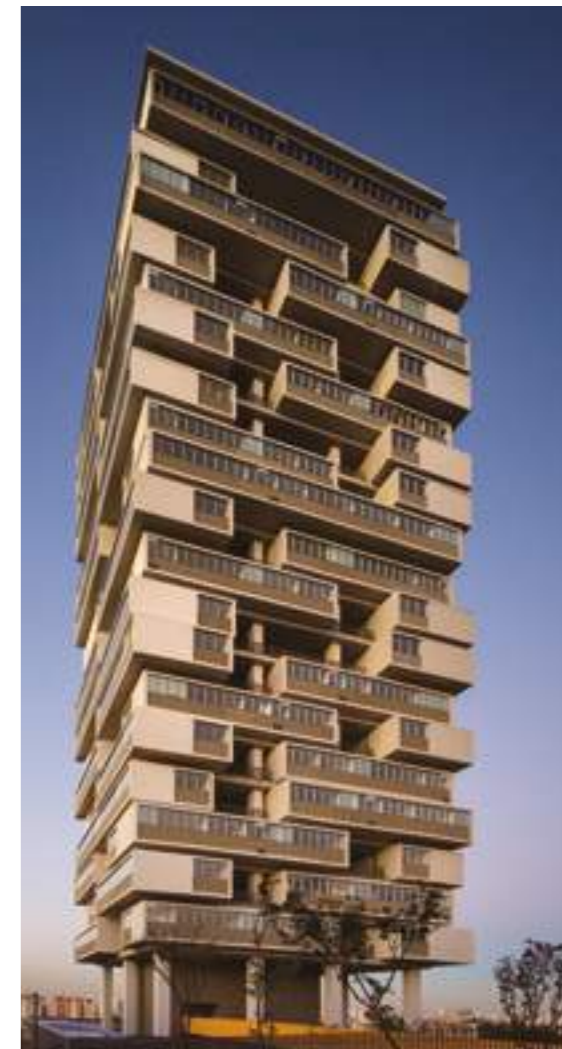
360° / ISAY WEINFELD