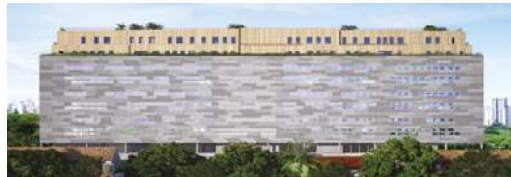
MIX 422 / ISAY WEINFELD