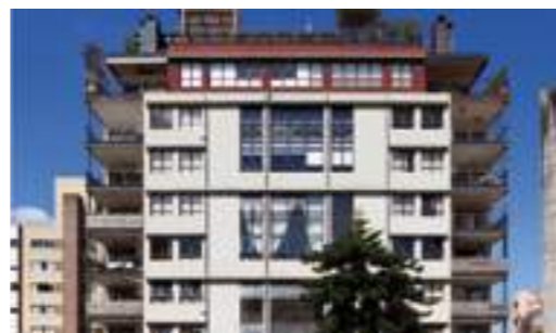
4X4 / GUI MATTOS