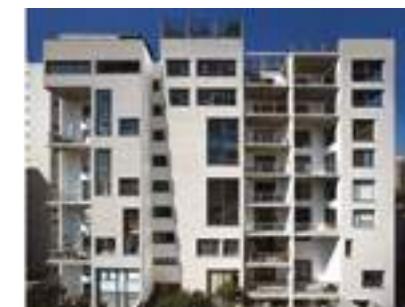
AIMBERÊ 1749 / ANDRADE MORETTIN