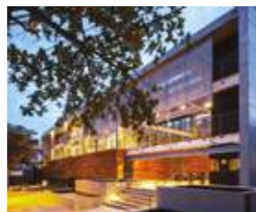
CORUJAS / FGMF